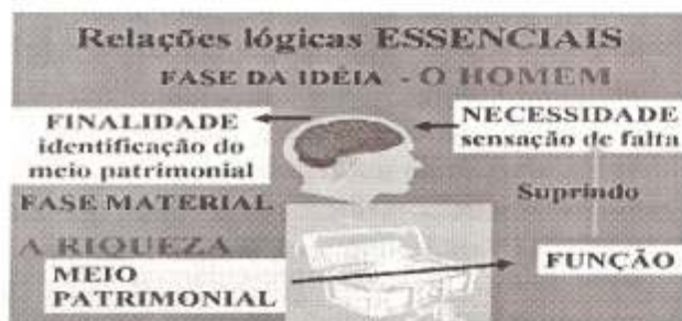
Figura 1: Extraído da apresentação em PowerPoint de Pires (2002).

A representação que permite uma perfeita visualização destas relações pode ser observada na Figura 1.